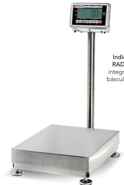
Indicador RAD-W20 integrado en báscula ERP-3